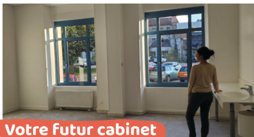
Votre futur cabinet

Rejoignez une équipe déjà en place, en plein cœur d'Aubusson, dans un des deux cabinets disponibles de 30 m², entièrement rénovés et lumineux avec parking et accès PMR.