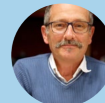
Didier MIOMANDRE - Maire de St-Yrieix-la-Montagne -