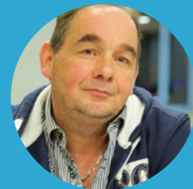
Didier TERNAT 6 ème VP Environnement - Energies renouvelables - Mobilités - Gestion des déchets - Maire de Croze -