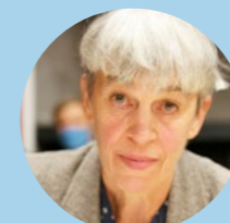
Nadine RAVET - Maire de La-Nouaille -