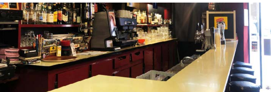
Soir de concert - Fête de la musique organisé par le bar en face de sa terrasse