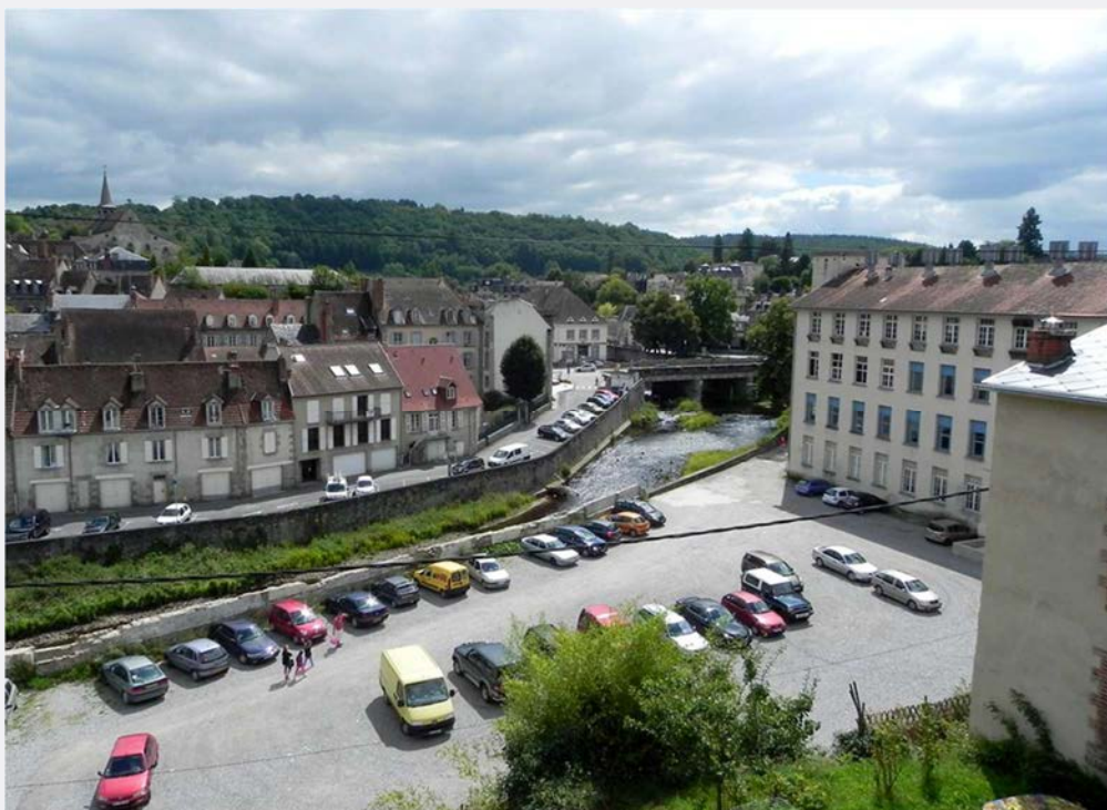
ERIP EC—Bâtiment La Passerelle - Aubusson