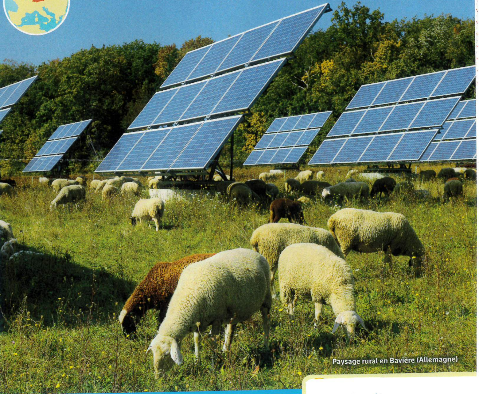
Paysage rural en Bavière (Allemagne)