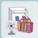
DECHETS ELECTRIQUES ET ELECTRONIQUES