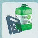
HUILES ET BIDONS MOTEURS - VIDANGES COMBUSTIBLES