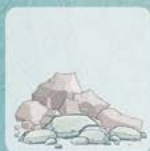
GRAVATS / INERTES