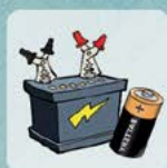
BATTERIES ET PILES