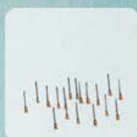
AIGUILLES DE SERINGUES USEEES