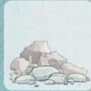
GRAVATS / INERTES