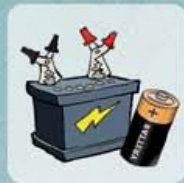
BATTERIES ET PILES