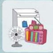
DECHETS ELECTRIQUES ET ELECTRONIQUES