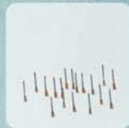
AGUILLES DE SERINGUES USEGEEES