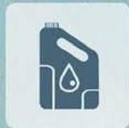
HUILES MOTEURS ET DE VIDANGE