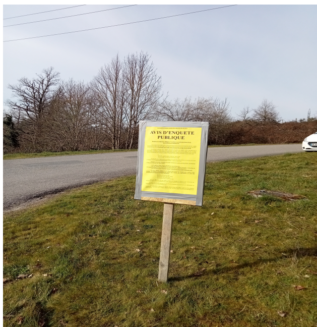
Cliché 2 : sur site

▫ respect des formalités administratives : le dossier complet a été déposé en temps utile à la mairie d'Aubusson et ce jusqu'au 12 mai 2021 à 17 h 30, heure de fermeture de la mairie et jour de la dernière permanence, y compris sur le site Internet dédié.