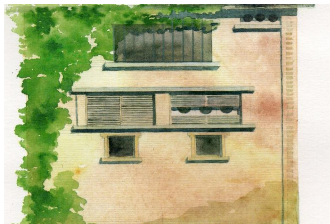
1 Lavaveix les Mines