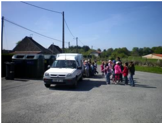
Tous les enfants devant le point propre.

À partir d'emballages, de bouteilles en plastique et de divers papiers, nous avons fabriqué des costumes et des accessoires.