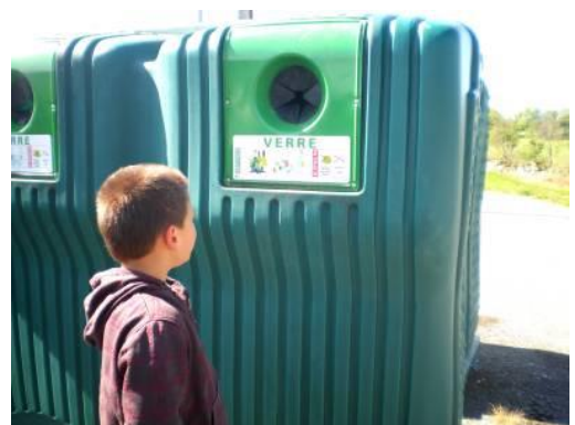
Le container à verre.