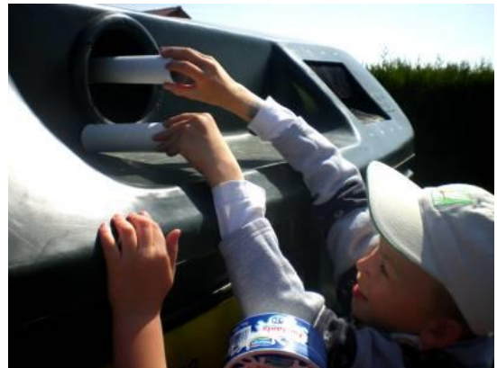
Tri des emballages en plastique.

Nous sommes allés trier ce qui ne nous avait pas servi au point propre.