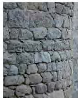
en maçonnerie assisée, chaque pierre correspond à un lit