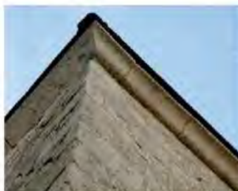
Corniche à doucine en forme de "S", signe de savoir-faire et de réussite sociale