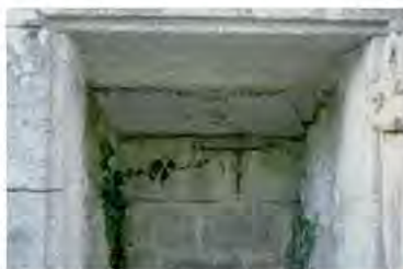
Puits en pierre de taille, couvert en dalles