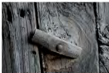
Système de fermeture d'un portillon