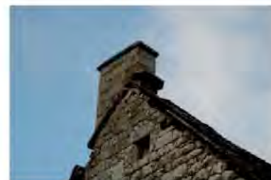
Souche de Cheminée