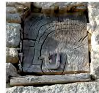
Symbolique dans la maison d'habitation : Linteau sculpté et poutre en bois ornée d'un fer à cheval