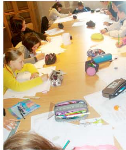
Tous les jeudis après-midi, les 6ème du collège de Felletin participent à un atelier de bandes dessinées.