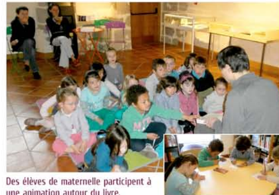
Des élèves de maternelle participent à une animation autour du livre.